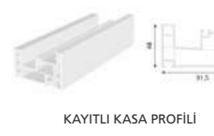
KAYITLI KASA PROFİLİ