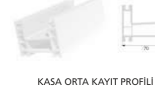
KASA ORTA KAYIT PROFİLİ