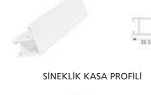
SİNEKLIK KASA PROFİLİ