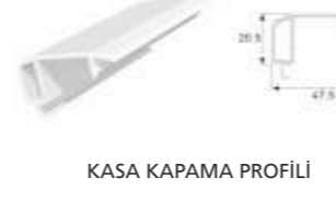
KASA KAPAMA PROFİLİ