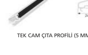
TEK CAM ÇİTA PROFİLİ (5 MM)