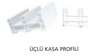
ÜÇLÜ KASA PROFİLİ