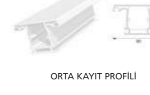
ORTA KAYIT PROFİLİ