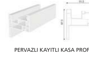
PERVAZLI KAYITLI KASA PROFİLİ