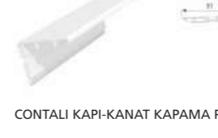
CONTALI KAPI-KANAT KAPAMA PROFİLİ