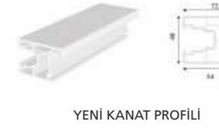
YENİ KANAT PROFİLİ