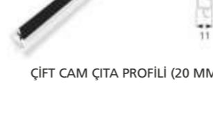
ÇİFT CAM ÇİTA PROFİLİ (20 MM)