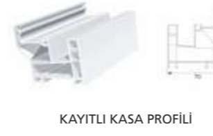
KAYITLI KASA PROFİLİ