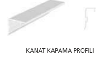
KANAT KAPAMA PROFİLİ