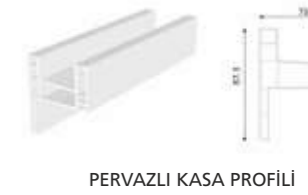
PERVAZLI KASA PROFİLİ