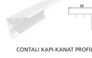
CONTALI KAPI-KANAT PROFİLİ