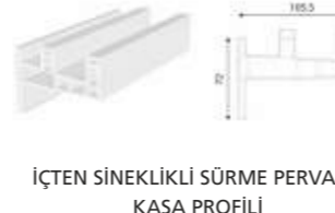
İÇTEN SİNEKLIKLI SÜRME PERVAZLI KASA PROFİLİ