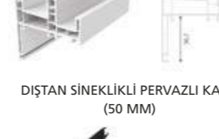
DIŞTAN SİNEKLIKLI PERVAZLI KASA (50 MM)