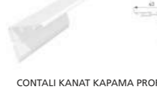
CONTALI KANAT KAPAMA PROFİLİ