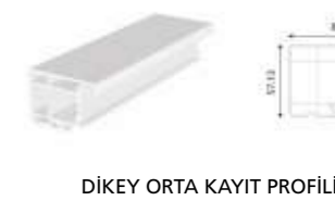
DİKEY ORTA KAYIT PROFİLİ