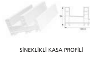
SİNEKLIKLI KASA PROFİLİ