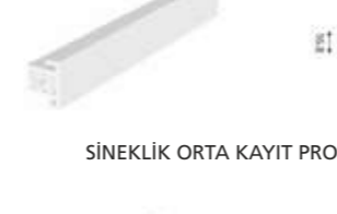
SİNEKLIK ORTA KAYIT PROFİLİ