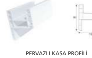
PERVAZLI KASA PROFİLİ