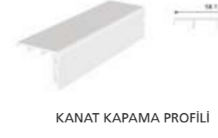
KANAT KAPAMA PROFİLİ