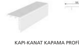
KAPI-KANAT KAPAMA PROFİLİ