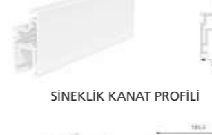
SİNEKLIK KANAT PROFİLİ